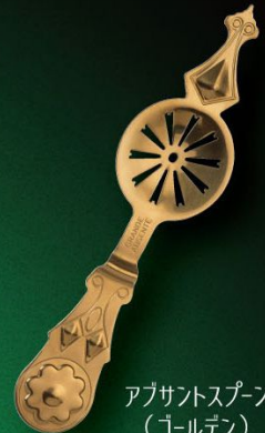
アブサントスプーン (ゴールデン) 入数 10