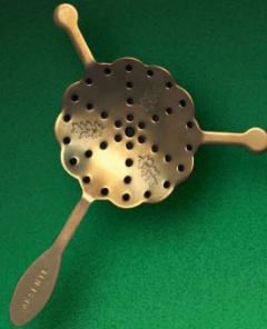
アブサントスプーン (ラウンド) 入数 10