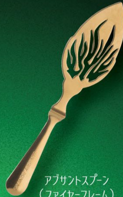
アブサントスプーン (ファイヤー-フレイム) 入数 10