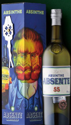
ギフト BOX(スプーン付) 入数 6