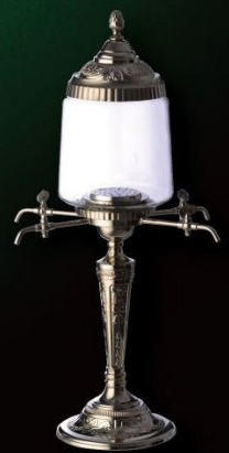
ファウンテン 4 口 入数 1