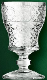
アブサント アンボワースグラス 入数 6