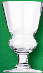
アブサント グラス 入数 6