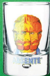
ゴッホ ショット グラス 入数 6