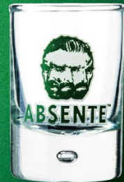
アブサント ルミナス ショット グラス 入数 6