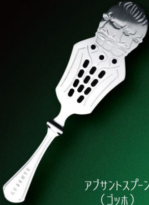
アブサントスプーン (ゴッホ) 入数 10